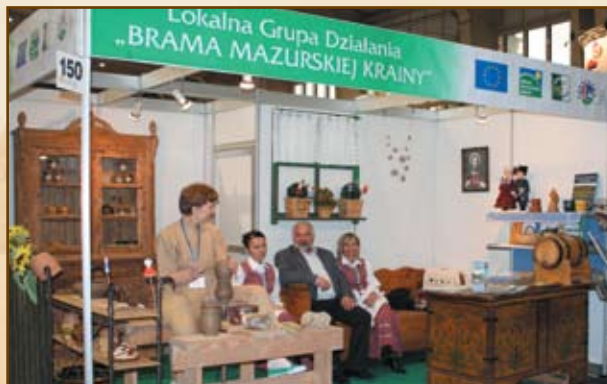
LGD „Brama Mazurskiej Krainy” na Targach Tour Salon 2010 w Poznaniu