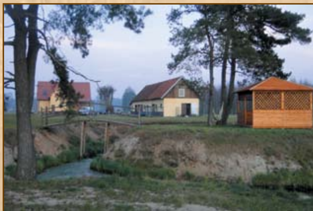
Gospodarstwo Agroturystyczne, Gluch, gmina Wielbark

UWAGA: Osoby tworzące własne przedsiębiorstwa oraz funkcjonujące firmy mogą dodatkowo korzystać z preferencyjnych pożyczek i poręczenia pożyczek i kredytów. Wsparcia takiego udziela Nidzicka Fundacja Rozwoju NIDA: 13-100 Nidzica, ul. Rzemieślnicza 3