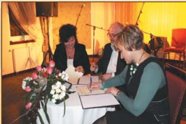
Podpisanie porozumienia o współpracy z LGD „Warmiński Zakątek”, Dobre Miasto

Współpracujemy także ze szwedzką lokalną grupą działania Leader Blekinge, w projekcie TRANSGRANICZNA PRZEDSIĘBIORCZOŚĆ Blekinge/Warmia-Mazury, którego celem jest wymiana doświadczeń z partnerami w Szwecji w zakresie rozwoju przedsiębiorczości wiejskiej, tworzenia nowych produktów turystycznych, aktywizacji społecznej mieszkańców wsi.