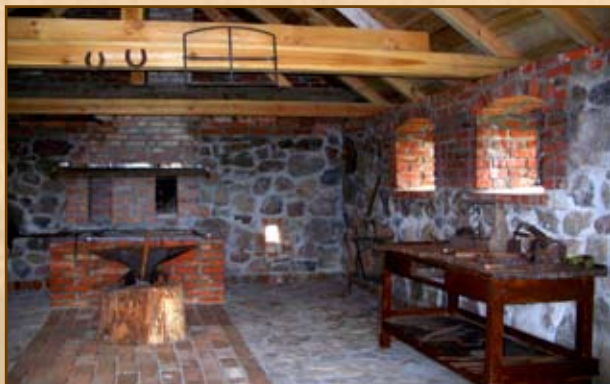
Kuźnia Mazurska, Kamionka

UWAGA: organizacje pozarządowe, które złożą wnioski o dofinansowanie w ramach „Małych projektów” mogą otrzymać pożyczkę w wysokości 16.000 zł bez oprocentowania, na okres do rozliczenia otrzymanej dotacji. Fundusz pożyczkowy utworzony został ze środków Polsko – Amerykańskiej Fundacji Wolności.