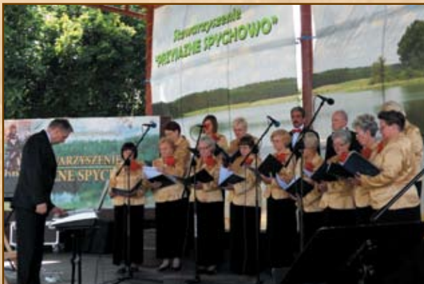
VI Otwarty Ogólnopolski Turniej Chórów o Miecz Juranda, Spychowo

W ramach tego przedsięwzięcia realizowane są m.in. projekty tworzące lokalne produkty turystyczne z wykorzystaniem zasobów kulturowych, historycznych i przyrodniczych, projekty proekologiczne, rozwijane są atrakcje i usługi turystyczne, organizowane są wydarzenia promocyjne oraz promujące tradycje rzemieślnicze i twórczość ludową, tworzona i modernizowana jest baza informacji turystycznej, budowana i modernizowana jest mała infrastruktura turystyczna.