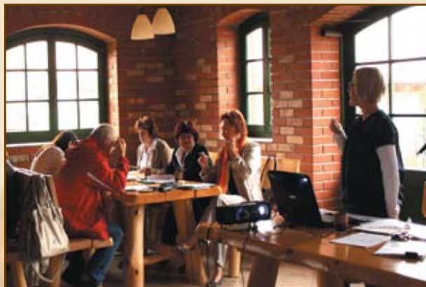
Szkolenie dla beneficjentów z rozliczania projektów

Pracownicy LGD „Brama Mazurskiej Krainy” udzielają bezpłatnych konsultacji w przygotowaniu i rozliczaniu projektów, organizują spotkania aktywizujące oraz szkolenia z zakresu przygotowywania i rozliczania projektów.