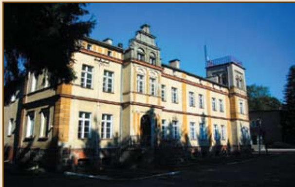
Uruchomienie restauracji „PALATIUM”, Pałac w Mysłotach

UWAGA: Osoby tworzące własne przedsiębiorstwa oraz funkcjonujące firmy mogą dodatkowo korzystać z preferencyjnych pożyczek i poręczenia pożyczek i kredytów. Wsparcia takiego udziela Nidzicka Fundacja Rozwoju NIDA: 13-100 Nidzica, ul. Rzemieślnicza 3