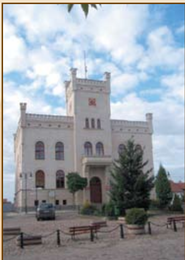
Neogotycki Ratusz w Pasymiu po rewitalizacji

LGD zgodnie z opracowaną strategią zachęca do składania projektów w zakresie budowy, remontu i wyposażenia obiektów infrastruktury społecznej, remontu zabytkowych obiektów i rekonstrukcji obiektów architektury wiejskiej.