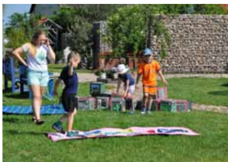
Na placu zabaw

Na trasie zwiedzania znajdują się: garncarnia – pokaz toczenia na kole garncarskim, kuźnia, sprzęty gospodarstwa wiejskiego, mazurska stodoła, Obserwatorium Przyrody, „Wróbelkowo”, prezentacja nt. mazurskich tradycji i obyczajów. Zwiedzanie trwa ok. 1 godziny. Zwiedzanie z przewodnikiem: cena biletu 10 zł, dzieci 5 zł, dzieci poniżej 4 lat – bezpłatnie. Dodatkowo organizujemy dla dzieci ognisko z pieczeniem kiełbasek