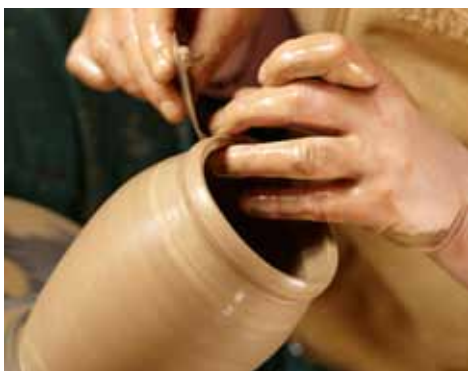
W pracowni garncarskiej

Na trasie zwiedzania znajdują się: garncarnia – pokaz toczenia na kole garncarskim, prezentacja nt. tradycji garncarskich na Mazurach, zwiedzanie muzeum garncarstwa. Zwiedzanie trwa ok. 1 godziny. Zwiedzanie z przewodnikiem: cena biletu 10 zł, dzieci 5 zł, dzieci poniżej 4 lat – bezpłatnie. Dodatkowo organizujemy dla dzieci ognisko z pieczeniem kiełbasek