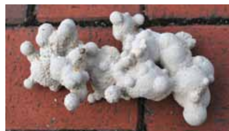
Kalcyt węgierski w galerii skarby Ziemi

Na trasie zwiedzania znajdują się: garncarnia pokaz toczenia na kole garncarskim, ziola w zielarni, kuźnia, mazurska stodoła, Obserwatorium Przyrody, prezentacja nt. mazurskich tradycji i obyczajów, „Wróbelkowo”, projekcja wybranego filmu przyrodniczego w Kinie Przyrody, Galeria „SKARBY ZIEMI”. Program trwa ok. 2 - 3 godziny. Każde dziecko otrzymuje na pamiątkę wybrany minerał z galerii „SKARBY ZIEMI”. Zwiedzanie z przewodnikiem: cena biletu 15 zł, dzieci 8 zł, dzieci poniżej 4 lat – bezpłatnie. Dodatkowo organizujemy dla dzieci ognisko z pieczeniem kiełbasek.