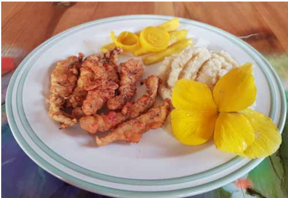
Schabuszki skuszą smakiem i widokiem każdego Tadka Niejadka

Organizujemy chrzciny, urodziny, spotkania rocznicowe, przyjęcia komunijne. Przygotowujemy upominki dla jubilatów i solenizantów. Zapewniamy miłą atmosferę, wyjątkowy wystrój pomieszczeń. Dla dzieci podczas wydarzeń organizujemy ciekawe zajęcia w garncarskiej, projekcje filmowe w Kinie Przyrody. „Garncarska Wioska” to wyjątkowe miejsce do organizacji spotkań firmowych. Zapraszamy na rodzinne weekendowe obiady. Wiosną polecamy mazurskie tradycyjne potrawy: dybdzalki w rosole, rosół z kury i z przepiórki, mazurską zupę pochłopka, mazurską szczawiankę, zupę zieloną, kakor, plince, pierogi, pieczoną kaczkę z jabłkami. Zapraszamy na wyjątkowe kotlety schabowe, a dzieciom proponujemy „półschabki” i schabuszki, które będą smakowały WSZYSTKIM TADKOM NIEJADKOM.. Do deserów podajemy ekologiczne, kandyzowane rajskie jabłuszka z Rajskiego Ogrodu.